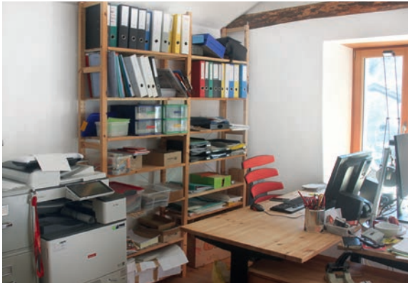
Im frisch renovierten Büro ist es jetzt wohlig warm

Solardach für die Casa del Pizzò: Dank des grosszügigen Legats von Sibyll Kindlimann und der sorgfältigen Planung durch unsere Solarfachleute im 2025 wird unser Lagerhaus nun mit einem flächendeckenden Solardach ausgestattet, dessen Strom danach in allen Häusern der Stiftung und sogar von Nachbarn genutzt werden kann, in Form der ersten Lokalen Elektrizitätsgemeinschaft (LEG) des Tales.