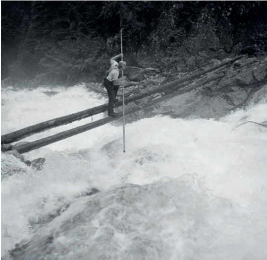
Flösser versucht, angespültes Holz auf dem Fellibach, UR zu entstauen; diese Praxis gab es auch auf der Calancasca.

Foto: Ernst Brunner, 1942, Empirisches Kulturarchiv Schweiz